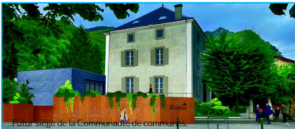
Futur siège de la Communauté de communes.

«A mi-mandat, de nombreux projets ont vu le jour ou sont sur le point de débiter : PLUiH, France services, Pôle enfance, dispositif Petite Ville de Demain, ZAE de Prat Long, contrat local de santé, opération Habitat, péri-scolaire, plan local de randonnée... Beaucoup de choses réalisées et beaucoup de projets à venir, dont le chantier du futur siège de votre Communauté de communes, pour des services publics au plus près de la population et des besoins du territoire».